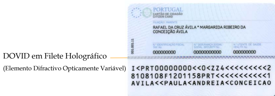
Figura 6-2 Características de segurança simples no verso do cartão de cidadão