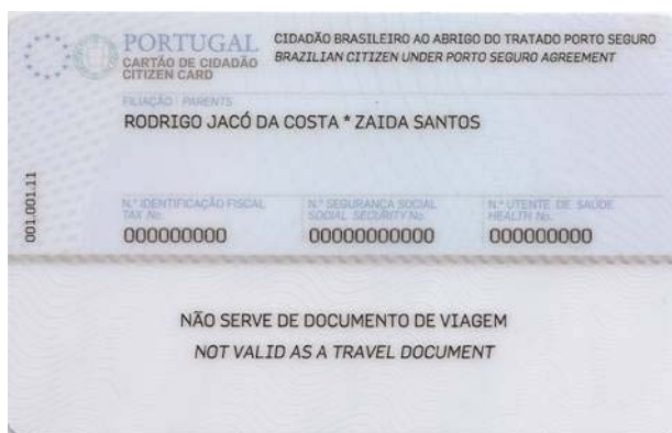
Figura 4-2 Verso do cartão de cidadão

Na zona de leitura óptica consta a menção de que o cartão de cidadão não serve como documento de viagem. Esta especificação decorre do disposto na Lei n.º 7/2007, de 5 de Fevereiro e no Decreto-Lei n.º 154/2003, de 15 de Julho.