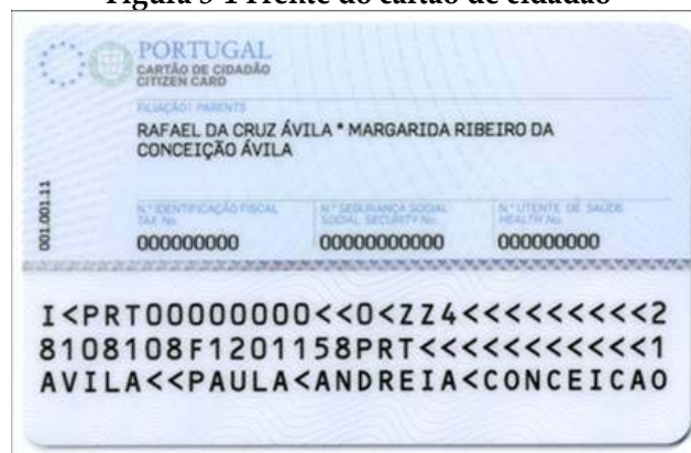
Figura 3-2 Verso do cartão de cidadão