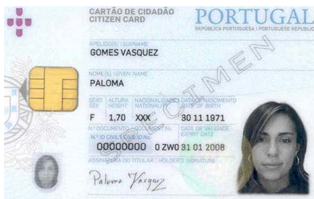
Figura 5-1 Frente do cartão de cidadão