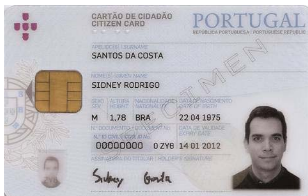
Figura 4-1 Frente do cartão de cidadão