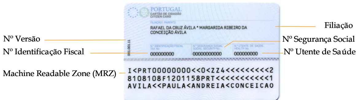
Figura 1-2 Informação inscrita no verso do cartão

O verso do cartão de cidadão contém informação textual específica dos actuais documentos de identificação sectoriais (Finanças, Segurança Social e Saúde) do titular, bem como uma zona de leitura óptica – Machine Readable Zone (MRZ).