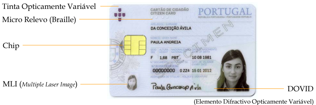
Figura 6-1 Características de segurança simples na frente do cartão de cidadão