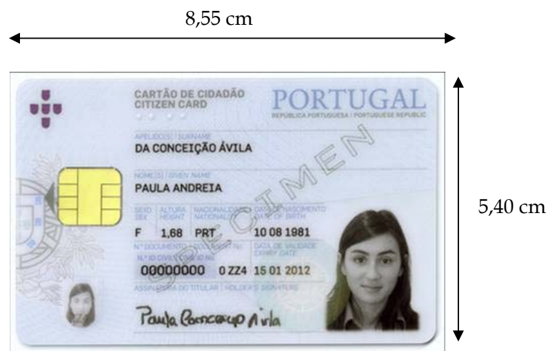
Figura 3-1 Frente do cartão de cidadão