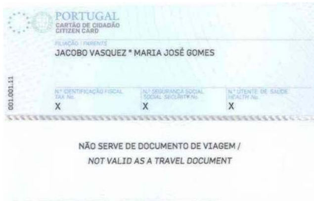
Figura 5-2 Verso do cartão de cidadão

Nesta situação o cartão de cidadão apresenta a validade de apenas de 1 ano, tendo em conta o disposto no artigo 61.º da Lei n.º 7/2007, de 5 de Fevereiro.